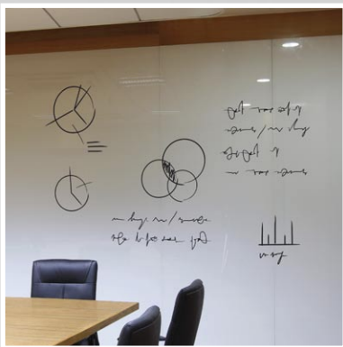
Mampara y pizarra