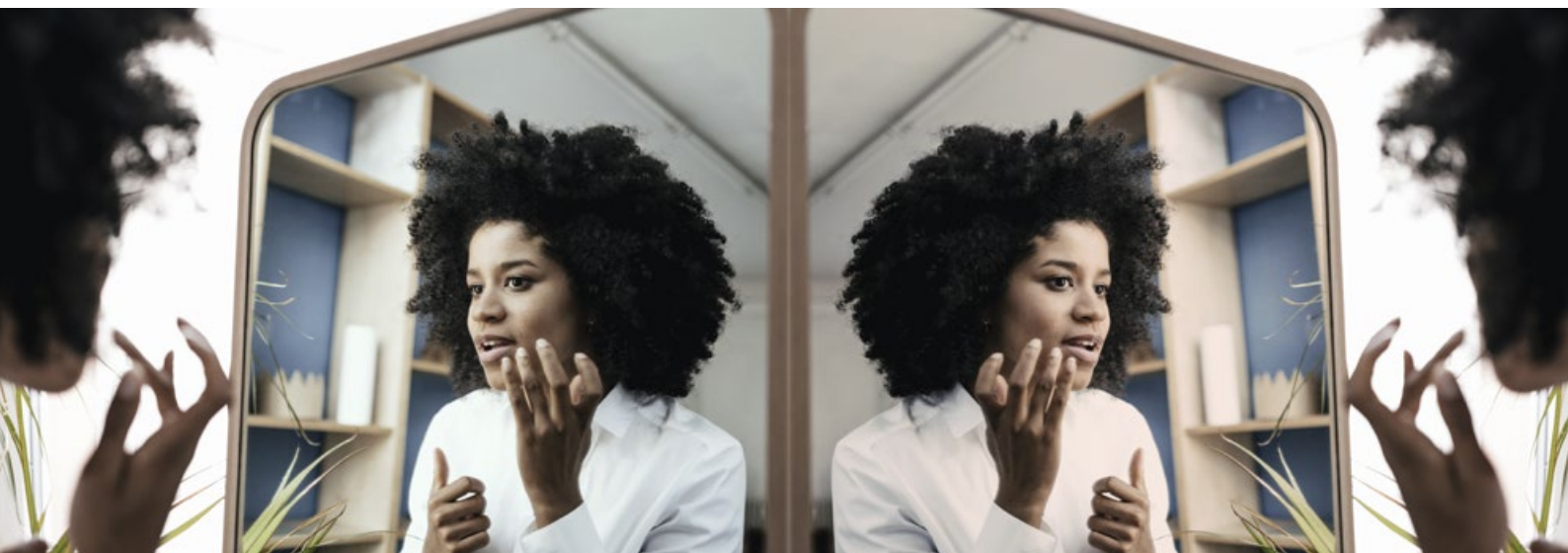
Reflejo en un espejo estándar